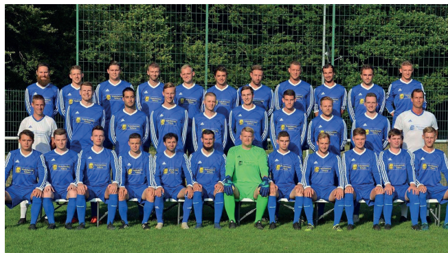
Senioren-Mannschaft SG LWN